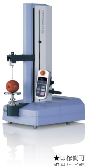
小型卓上試験機 EZ-SXシリーズ★