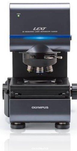
島津 3D測定レーザー顕微鏡★