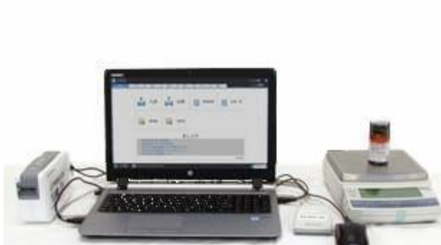
島津トラステック 薬品管理システム