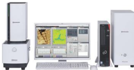
走査型プローブ顕微鏡 SPM-Nano