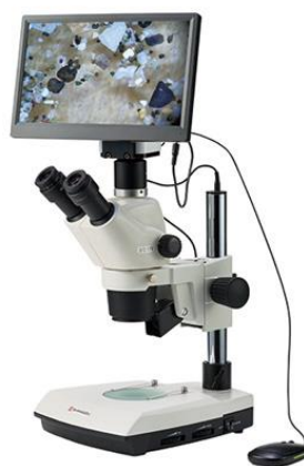
島津理化 デジタル実体/生物顕微鏡★