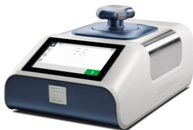
乾式自動密度計 アキュピックIII 1350