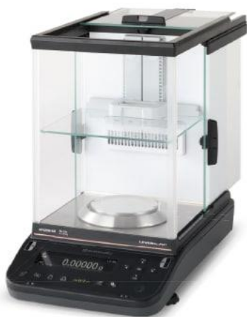
島津 オートマ分析天秤