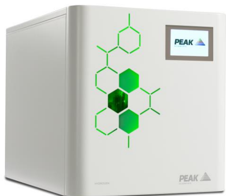
ピークサイエンティフィックス ジャパン 水素ガス発生装置