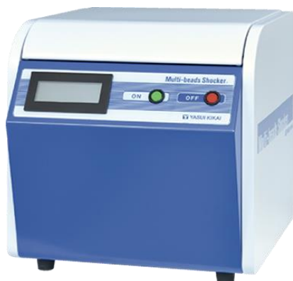
安井器械 次世代秒速粉碎機★